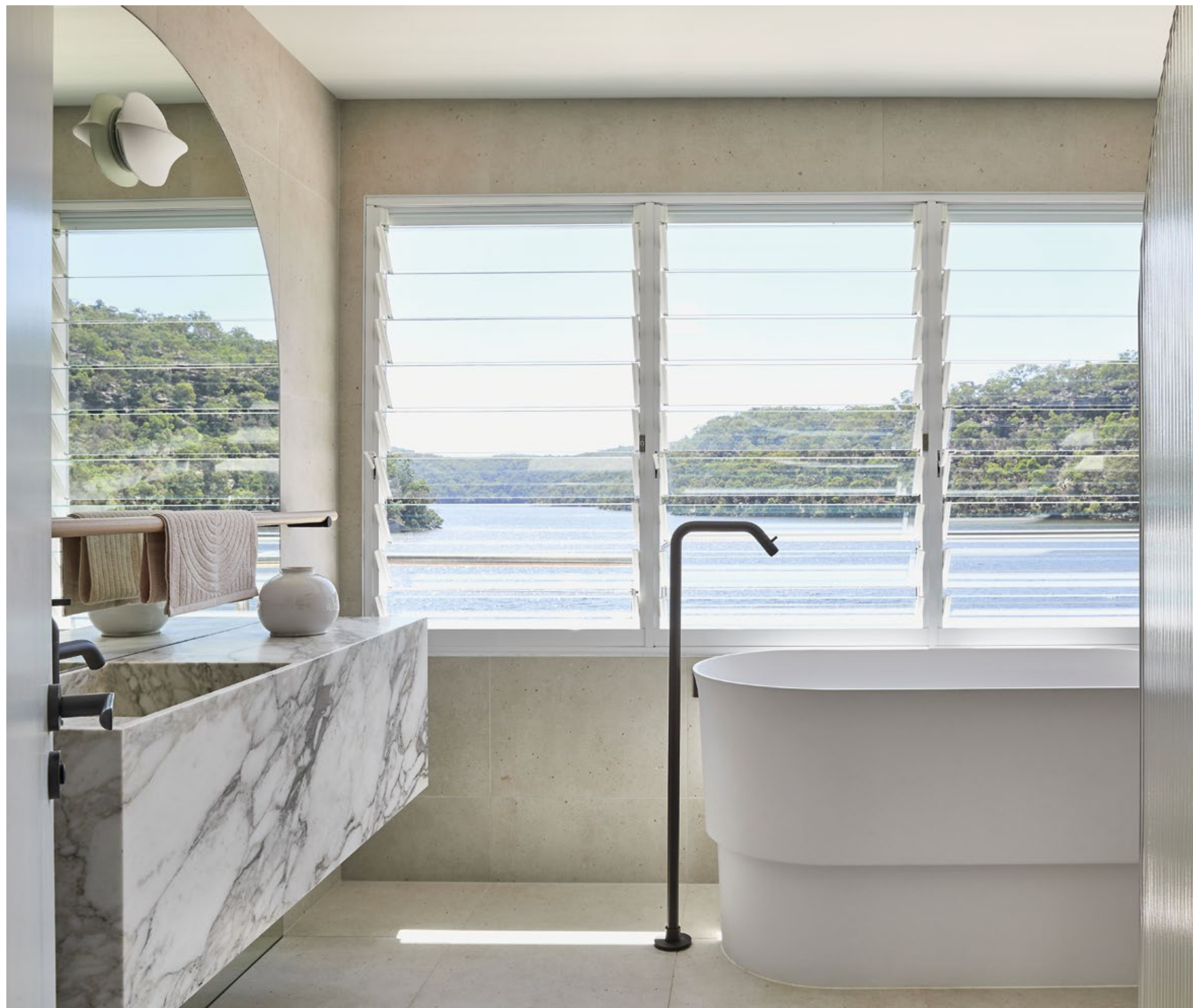
A destra: vasca Immersion, rubinetti Memory, barra accessoriabile Dot Line On the right: Immersion bathtub, Memory taps, Dot Line towel holder

Indeed, even in designing the space, the sweeping panorama was the main focus. "From a purely aesthetic point of view, we had to walk a fine line between a strong design outcome, and not overshadowing the hero of the home, which is always the view", posits Whiting, who organized each of the home's rooms around the broad picture windows. "Our palette was simple and planned to compliment the exterior sandstones, river hues, and natural beauty of the surrounding Australian bushland. We consciously used curves where possible in a not-too-subliminal message that this home was somewhere to 'take the edge off' life in the fast-paced world". To ensure the interiors were subtle, sunny and bright, Whiting opted for white marble countertops, furniture hewn in blonde wood and cream-coloured walls. The bathroom was treated with a similar sense of reverence for the natural world. Whiting set Agape's Immersion soaker tub directly next to the window, allowing guests to enjoy the view of the meandering river, dense forest and endless Australian sky.