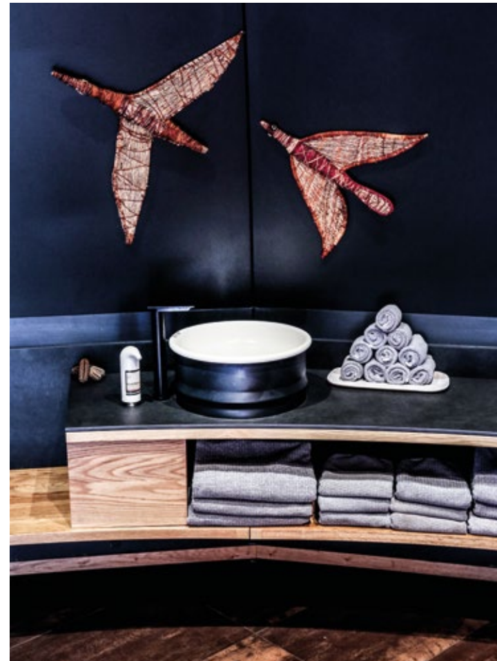
In queste pagine: vasca e lavabo Vieques On these pages: Vieques bathtub and washbasin

However, the most show-stopping decoration is undoubtedly the stunning view, which is why every element within the private pavilions — including the bed, curved sectional sofa and even the outdoor jacuzzi — has been orientated towards windows that look out over the national park. Even the bathtub has a front row view to Uluru-Kata Tjuta's natural beauty. The Vieques bathtub sits next to the bathroom windows, allowing guests to soak in the outback's sublime beauty in absolute peace.