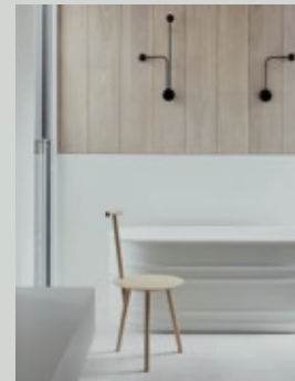
Sage House Melbourne, Australia Architecture / Interiors: Carole Whiting

Bjhn 2 lavabo washbasin Solid specchio mirror Nivis lavabo washbasin