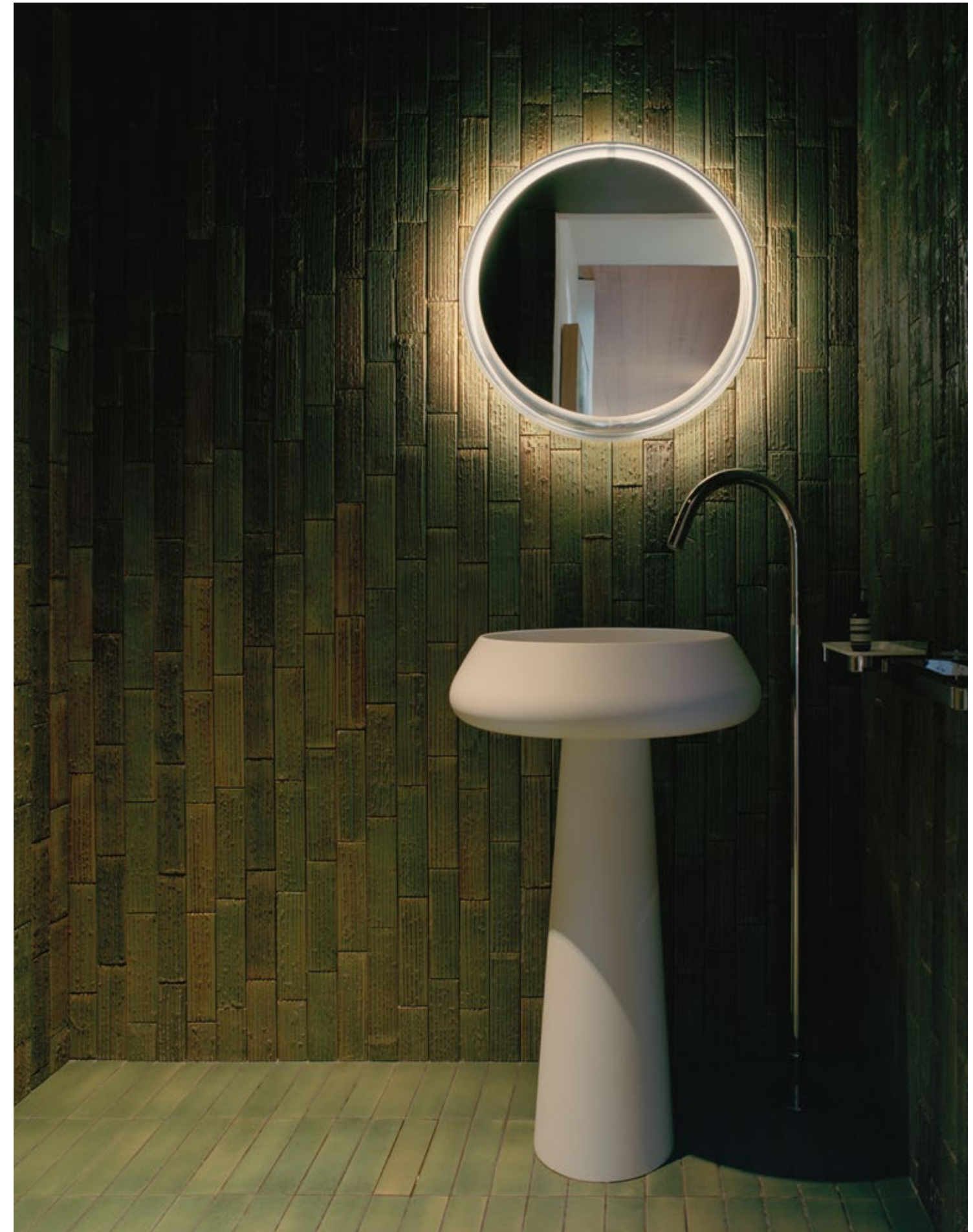
A destra: lavabo Bjhon 2, accessori Memory, specchio Solid On the right: Bjhon 2 washbasin, Memory accessories, Solid mirror