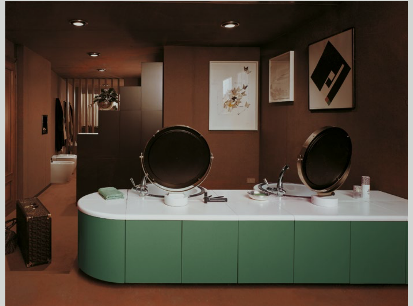
Il sistema Erion fotografato a Mantova nel 1975 per una campagna pubblicitaria dell'azienda. The Erion system photographed in Mantova in 1975 for an advertising campaign.

EN When it comes to bathroom architecture, timeless needs call for timeless solutions. Our projects and products defy the zeitgeist and passing trends to offer long lasting solutions thanks to the quality of our materials and to the adherence to good design principles that will never go out of fashion.