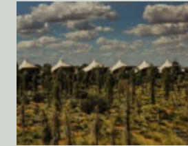
Baillie Lodges Longitude 131 Uluru, Australia Architecture / Interiors: Max Pritchard Gunner Architects

Vieques vasca bathtub lavabo washbasin Dot Line accessori accessories